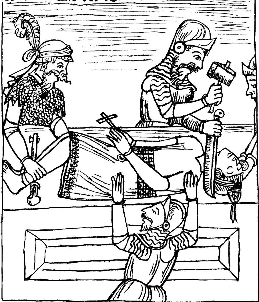
murió atagualpa en la ciudad de Cajamarca