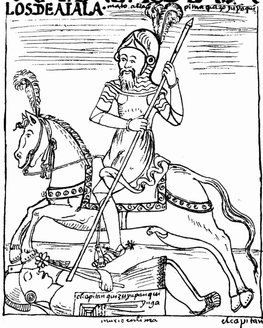
Conquista / Capitán Luis Avalos de Ayala, mató al capitán Quizo Yupanqui / el capitán Quizo Yupanqui Inga / murió en Lima.