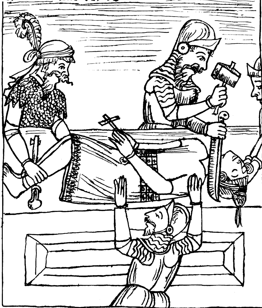
murió atahualpa en la ciudad de Cajamarca