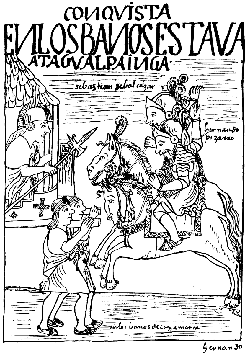
Conquista / En los baños estaba Atahualpa Inga / Sebastián de Balcázar. (Benalcázar) / Hernando Pizarro / en los baños de Cajamarca.